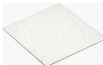
Figure 6 : Carreau de verre