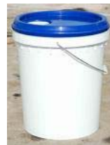
Figure 5 : Seau 16 L en plastique