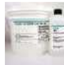
Figure 4 : Silgard 184