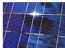
Figure 2 : Réseau de piles solaires Evergreen