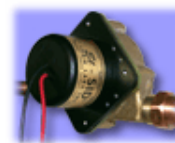
Figure 3 : Pompe SID10PV